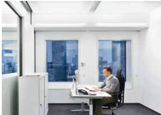
B2 | Das mit der LEED-Auszeichnung in Platin und dem Gold-Zertifikat der Deutschen Gesellschaft für Nachhaltiges Bauen (DGNB) ausgezeichnete Gebäude bietet für die fast 3000 Mitarbeiter ein angenehmes Arbeitsumfeld.