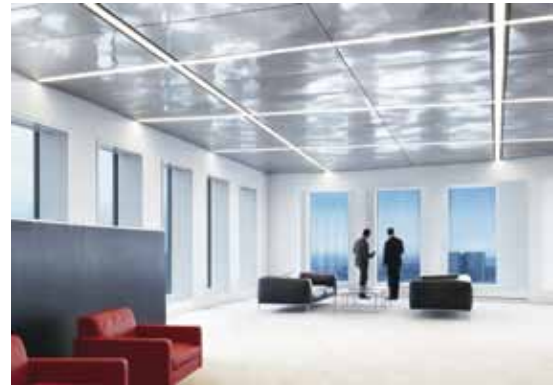
B3 | Licht wird bei der Sanierung der Deutschen Bank zu einem essentiellen Gestaltungswerkzeug. Dabei kommt es vor allem auch auf die richtige Mischung aus Tages- und Kunstlicht an

stein, schwarzes gewachstes Eisen für raumbildende Inszenierungen, Stucco Encausto für die Wandoberflächen oder satiniertes, mit LED hinterleuchtetes Glas stehen für Ehrlichkeit und Nachhaltigkeit.