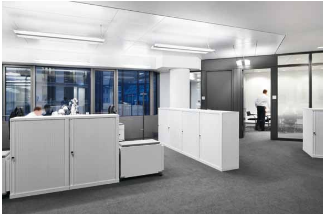
B7 | Als Pendelvariante erhellt die Schwertleuchte unter anderem die Arbeitsplätze im Sockelgeschoss.

ihren eigenen Charakter. Als Herausforderung erwiesen sich dabei die fugenlosen Stöße an den Kreuzungen. Die 1,2-W-LEDs mit 3000K Farbtemperatur und breitem Abstrahlwinkel sorgen zusammen mit der opalen PMMA-Abdeckung für ein homogenes Erscheinungsbild. LED-Bestückung und 73% Leuchtenbetriebswirkungsgrad sind zudem vorbildlich bei Energieeffizienz und LEED-Kriterien. Ganz spe-