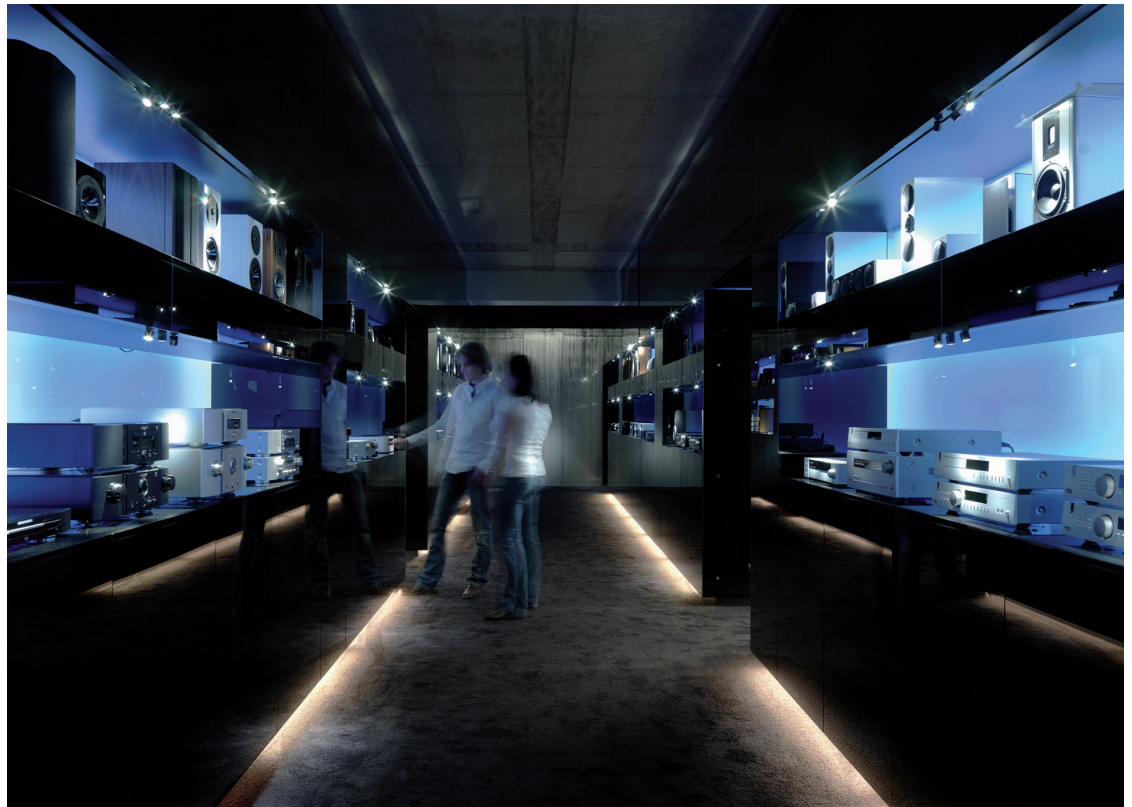
B2 | Die Linaria Einzellichtleisten und das Lichtsystem Supersystem fügen sich hervorragend in das puristisch-moderne Design des Fachgeschäfts ein.

den mit Hilfe von Cardan-Spirit Einbauleuchten gemütlich erhellt. Durch den 45° Grad kardatisch schwenkbaren Leuchtenkopf lassen sich die Einbauleuchten flexibel im Raum positionieren. Die warmen Lichtfarben schmeicheln den puristisch-modernen Hightech-Produkten und verleihen ihnen einen anmutenden Charakter. Abgerundet wird das Lichtlösungspaket von Zumtobel im Untergeschoss durch die LED-Bodeneinbauleuchten Paso II sowie das Einbau-Downlight 2Light Mini mit integrierten Revox Lautsprechern.