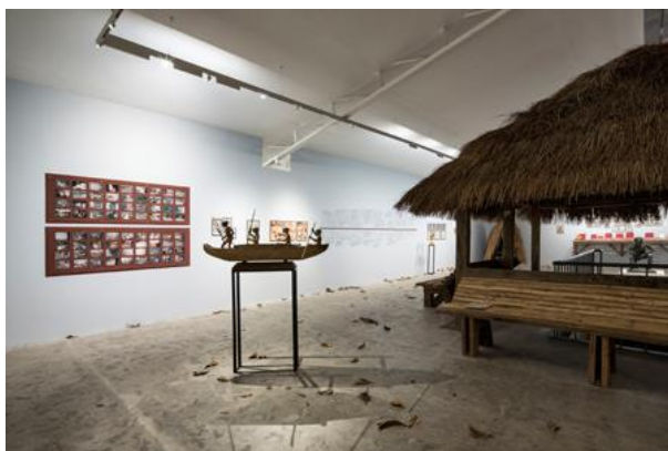
Fig. 2: Kuratorin Jam Acuzar hatte schon früh die Vision, einen Ort zu schaffen, der Kunst allen Menschen zugänglich macht. Im Vordergrund soll nicht die Sammlung oder der Verkauf, sondern der Dialog und die öffentliche Zugänglichkeit der Kunst stehen.

Fig. 1: Der Kunstraum Bellas Artes Outpost in Manila, beleuchtet durch SUPERSYSTEM II von Zumtobel. Das Besondere an dem multifunktionalen Lichtwerkzeug ist, dass je nach Aufgabe unterschiedlichste visuelle Effekte erzielt werden können.