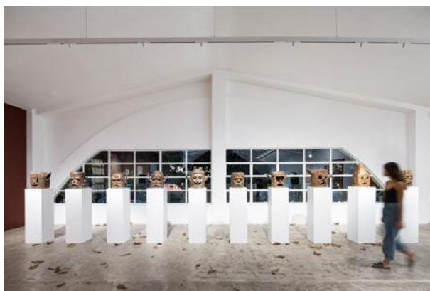
Fig. 5: Das Besondere an der SUPERSYSTEM II Toolbox ist, dass je nach Aufgabe unterschiedlichste visuelle Effekte erzielt werden können. Die Miniatur-Strahler sind prädestiniert für die punktgenaue Akzentuierung.