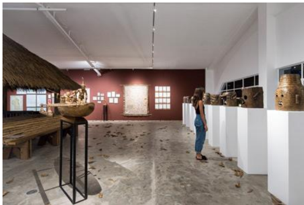
Fig. 4: Die schmalen Schienen sowie die puristischen Leuchten selbst bleiben im Hintergrund und beeindruckt mit filigranem Design, hochwertiger Materialisierung und ausgezeichneter Leuchtkraft.